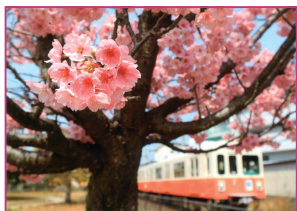
写真部門 フリーの部・ポートレートの部/金賞 川窪 亮祐様 『冒険の日が到来』

日 時 2月22日(日) 9:30~ 16:45 場 所 牟礼総合体育館 対 象 バランスのとれた走行が可能な 障害のある方 (小学生以上) 定 員 14チーム (個人申込み可) 締 切 2月8日(日) 参加費 500円/人