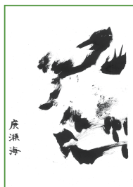
書道部門/銀賞 廣瀬 海様 『心』