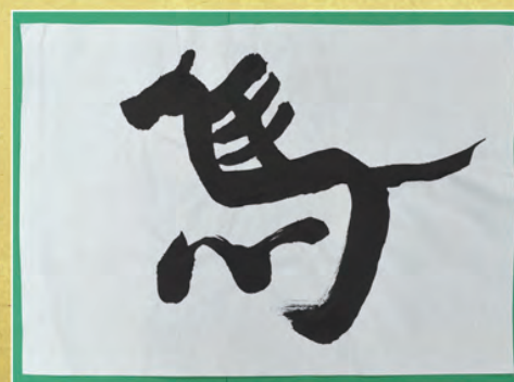
成人支援施設 新春のアートワーク作品