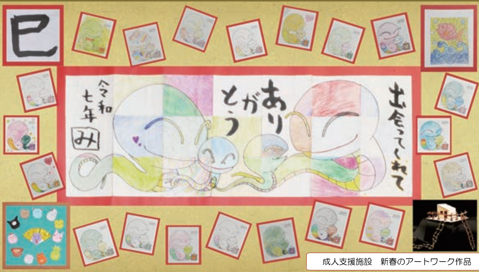
成人支援施設 新春のアートワーク作品

工事のお知らせ 令和6年12月から病院屋上防水改修工事を行っております。利用者の皆様には、騒音など大変ご迷惑をおかけしますが、ご理解とご協力の程よろしくお願いたします。