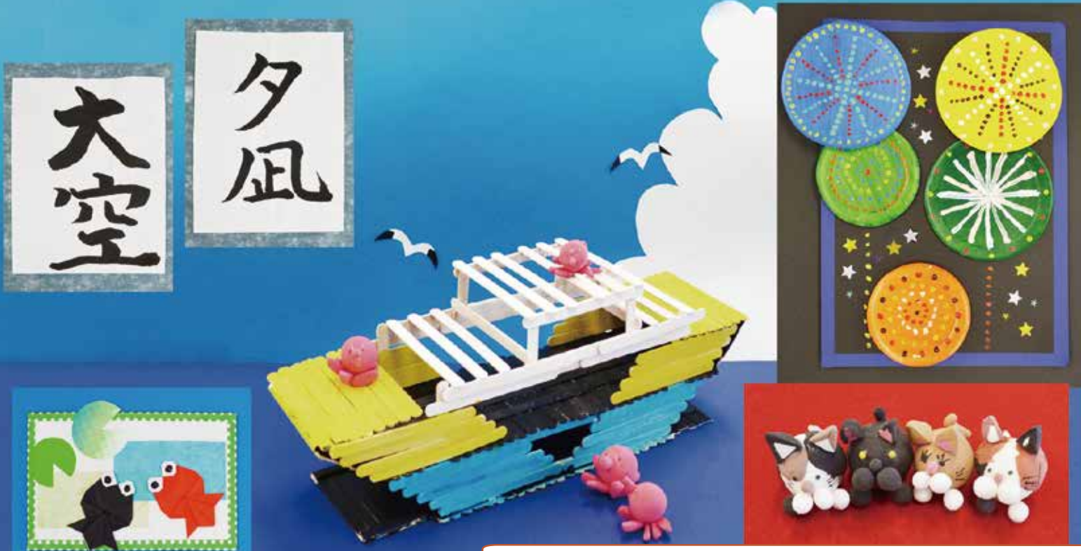
成人支援施設 盛夏のアートワーク作品