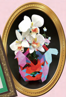
成人支援施設 薫風のアートワーク作品