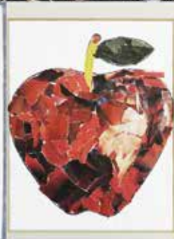
成人支援施設 早春のアートワーク作品

令和6年5月1日(水) リハビリテーション福祉センター 温水プール OPEN!!