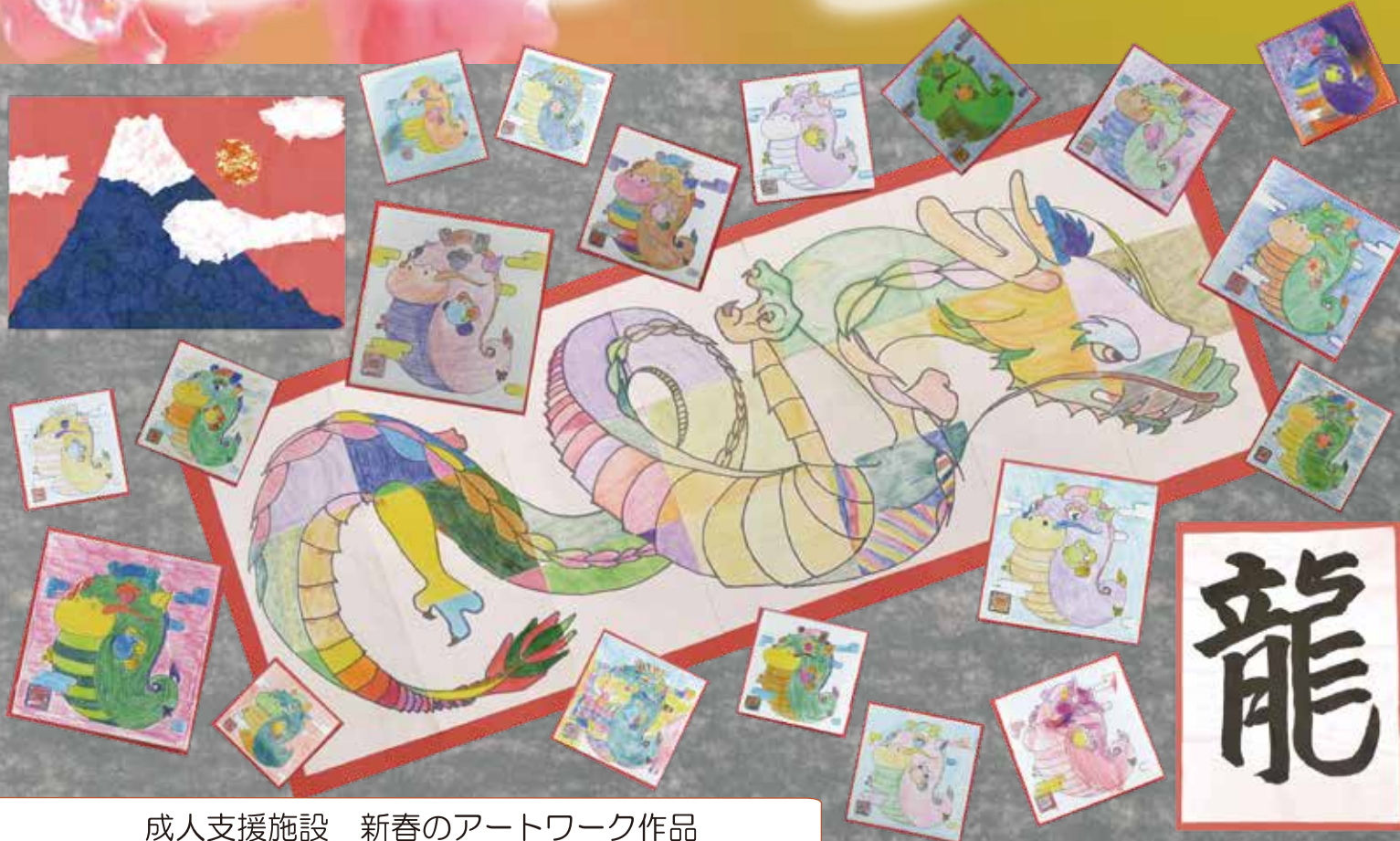
成人支援施設 新春のアートワーク作品