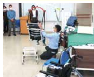
協力：株式会社モリトー