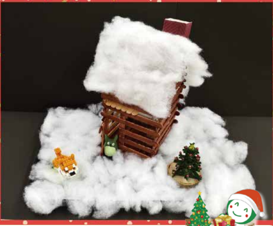
向寒のアートワーク作品