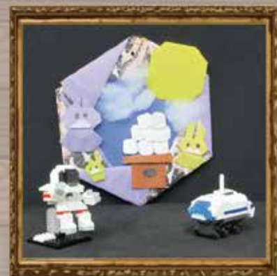
初秋のアートワーク作品