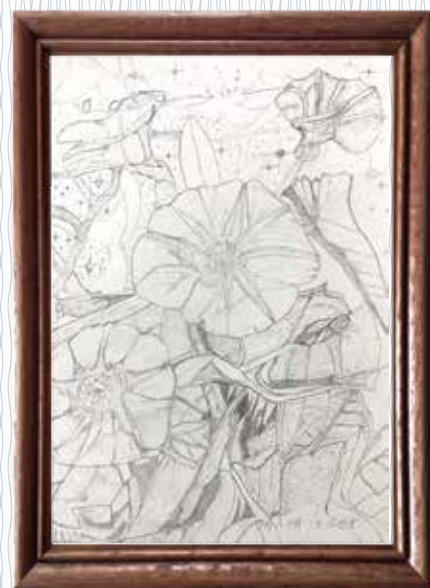
「ひるがお」 (脳機能リハビリテーションセンター) 夢