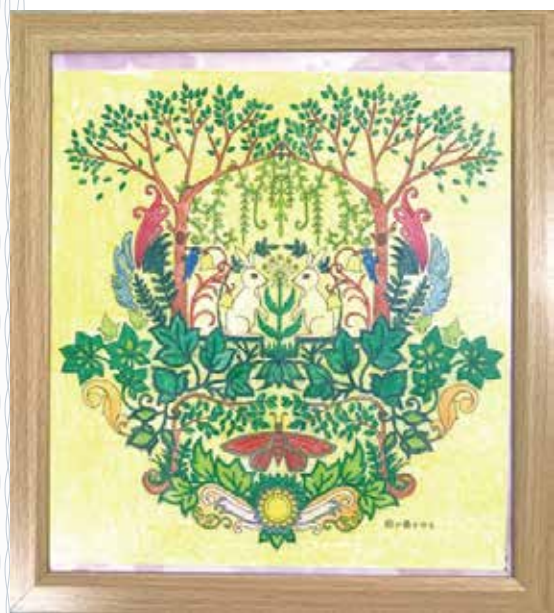
「ラビットの会話」 (脳機能リハビリテーションセンター) 楽しく描けました。