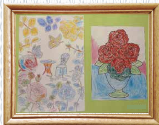
「ばら」(たまも園) 毎日、みんなで塗り絵をしたり、カラオケをしたりして楽しんでいます。