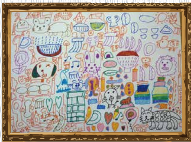
「ゆかいな羽ばたきのひととき」 (ふじみ園おおぞら利用者) 集中してがんばって描きました。