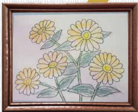
「百日草」(たまも園) 24色の色えんぴつを買いました。 楽しく塗っています。