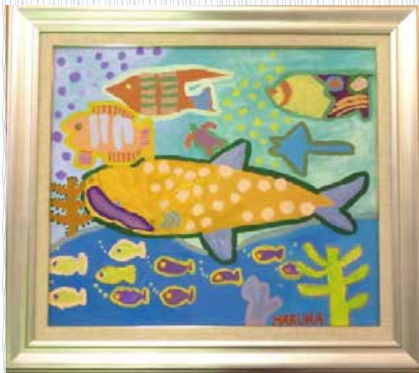
「沖縄の水族館」 (HARUNA) 沖縄旅行の思い出