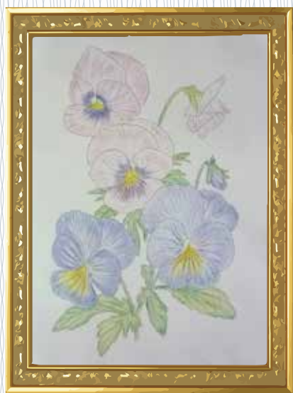
「パンジー (大人の塗り絵)」 (朝日園) 色えんぴつで、グラデーションや濃淡 に気を使いながら丁寧に描きました。