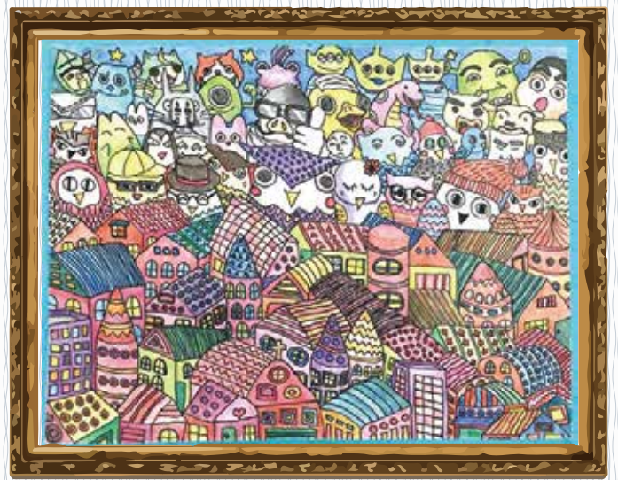
「GO HOME!」 (脳機能リハビリテーションセンター) 帰途につく人達を迎えるあたたかい家