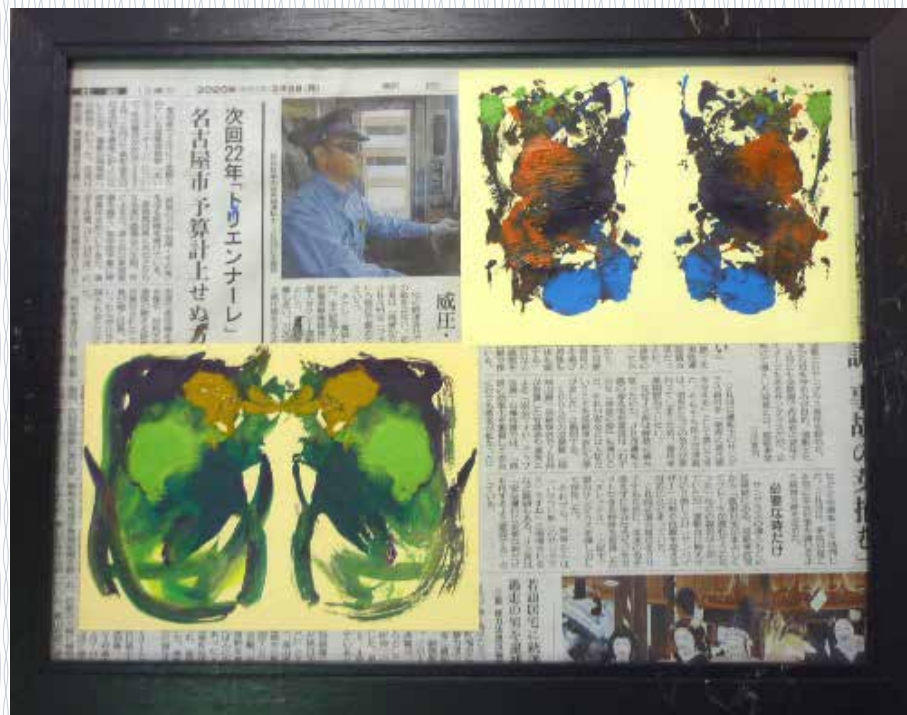
よくぼうずま 上：「欲望渦巻く」 下：大阪メトロ