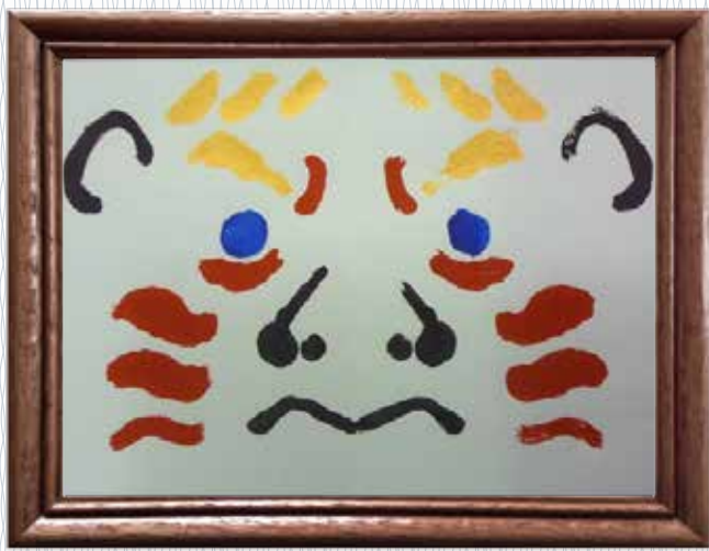
くまどりやろう 「隈取野郎」