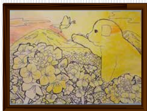
「菜の花と犬」(たまも園) 一番好きなことは塗り絵です。