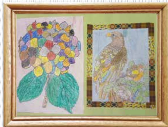
「あじさい」「わし」(たまも園) 集中して色々な色で塗っています。