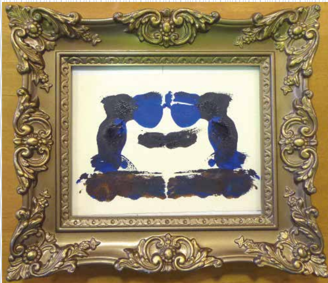
木の上に止まっている鳥