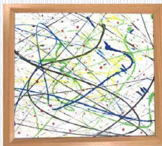
「川の流れ (ビー玉アート)」 (脳機能リハビリテーションセンター) ビー玉の自由な表現