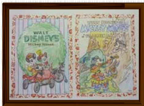
「ポストカード」(たまも園) おかあさんに送ります。 「喜んでくれるかしら…?」