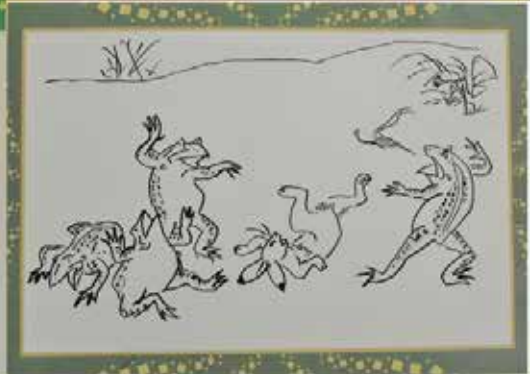
薫風の5月アートワーク作品