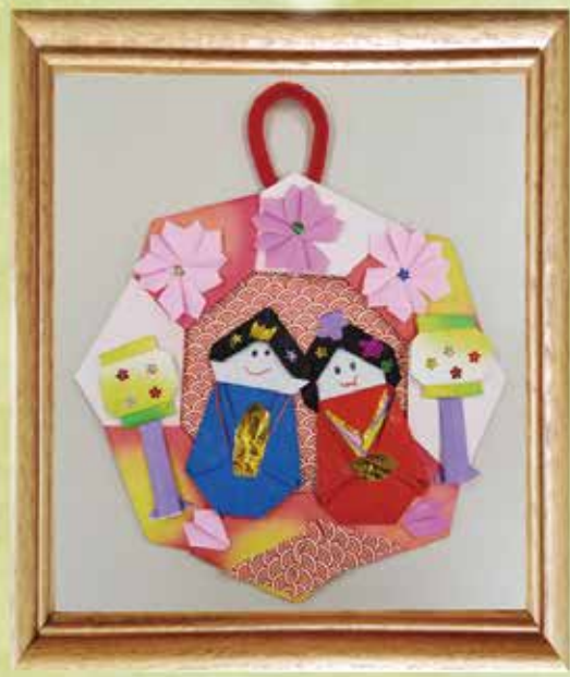
陽春のアートワーク作品