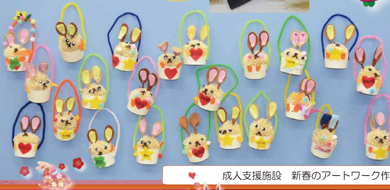
成人支援施設 新春のアートワーク作品