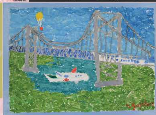
爽秋のアートワーク作品