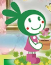
成人支援施設 陽春のアートワーク作品