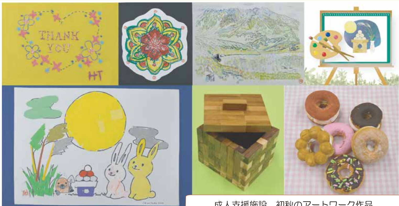
成人支援施設 初秋のアートワーク作品