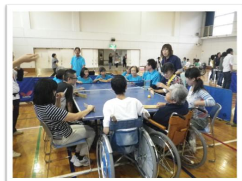
車椅子に乗ったままの参加も OK!