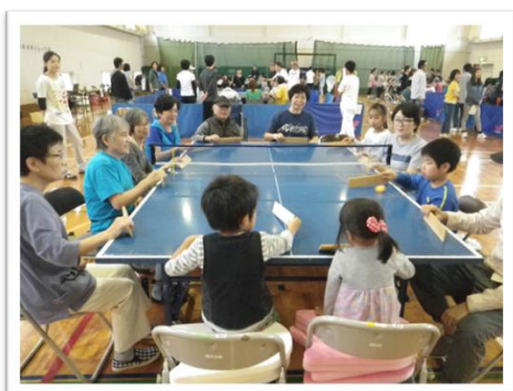
ちいさい子どもでも楽しめます♪

毎年10月、かがわ総合リハビリテーションセンターにて「香川県卓球バレー大会」を開催しています。障がい者を対象とした【チャレンジクラス】と、障がいの有無に関わらず、卓球バレーを通して交流することを目的とした【交流クラス】に分かれて行われます。どなたでも参加でき、一緒に楽しみ、交流できる大会です。12月8日には三豊市で開催します。