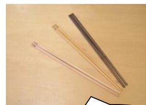
お箸（はし）の イメージ図